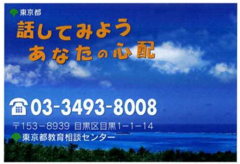
相談カード (高校生用)

相談カードは、児童・生徒自身も相談できることを知らせるものです。東京都内の小学校(部)5年生、中学校(部)2年生、高等学校(部)1・2年生に毎年配布しています。昨年度は、小学生からの電話相談は約570件ありました。配布時、担任の先生から、悩みがあったら電話をするように声をかけてください。高校生用は、ポスターと同じ写真を使用し、開放的なイメージにしました。